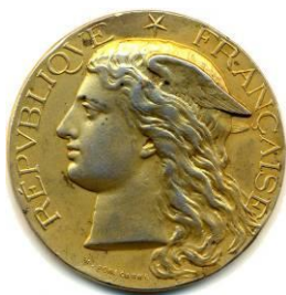
VERMEIL Rond 42,1 mm Poids 37,70 g Graveur H.PONSCARME