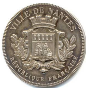
ARGENT Rond 38,8 mm Poids 27,30 g Graveur ???