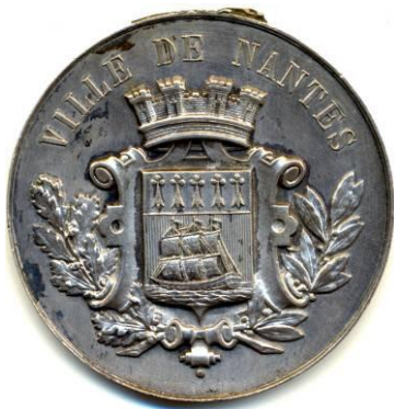
BRONZE ARGENTE Rond 46,9 mm Poids 31,10 g Graveur