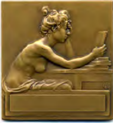
Alexandre CHARPENTIER , Société des Amis du livre , 1898 Bronze, 119gr Copyright Monnaie de Paris