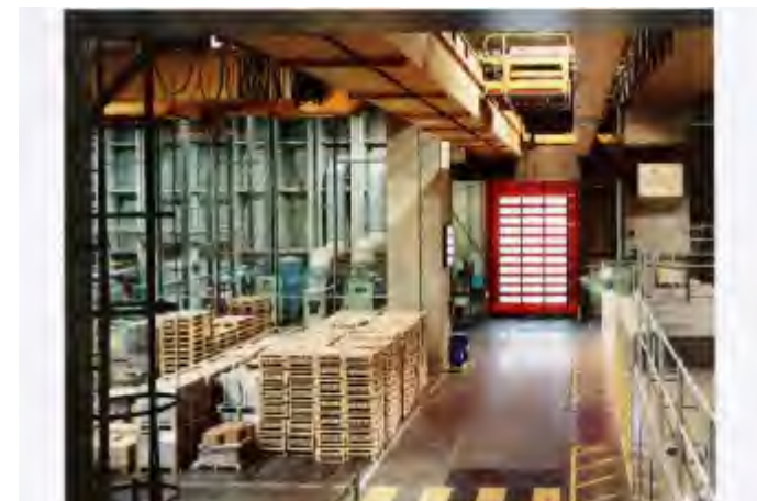
Site industriel de Pessac, Gironde