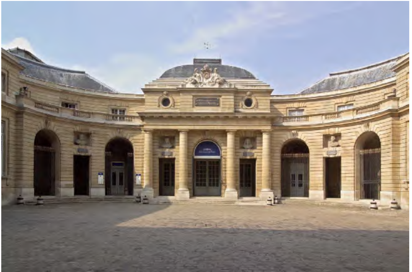
Cour d'honneur de la Monnaie de Paris, quai de Conti (Paris)