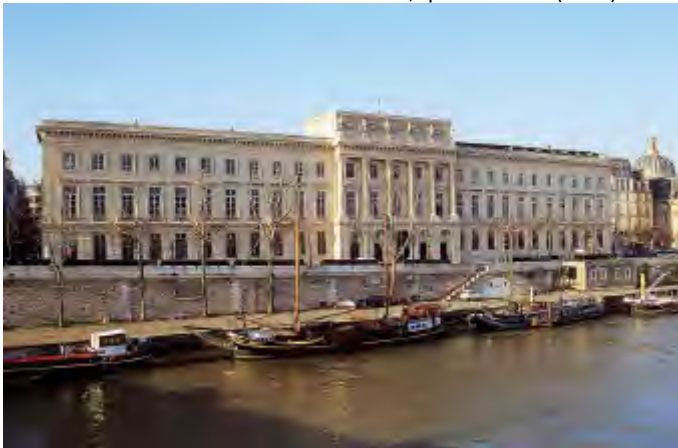
Façade du Palais du quai de Conti