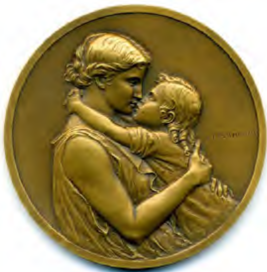
George-Henri PRUD'HOMME , Mère et enfant , 1938 Bronze, 138 gr