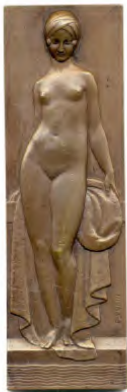
Pierre TURIN , Baigneuse , 1938 Bronze