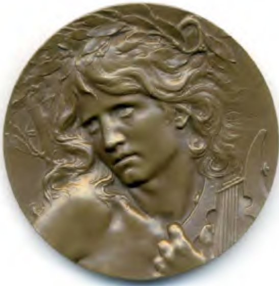
Lucien COUDRAY , Orphée , 1899, Bronze, diamètre 68mm