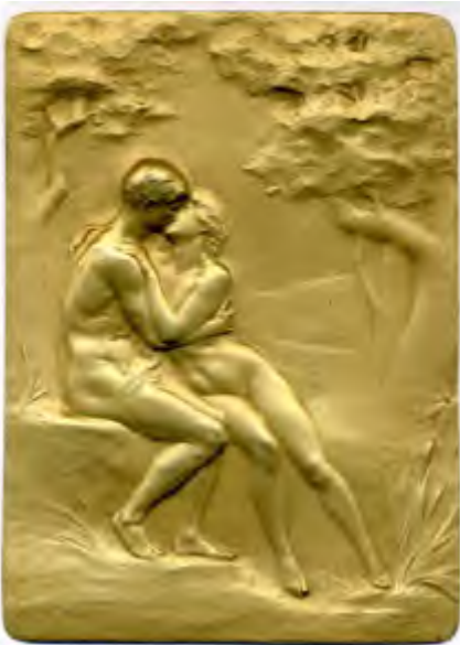
Frédéric Charles Victor de VERNON Premier Baiser , non daté 151x108mm, cuivre doré