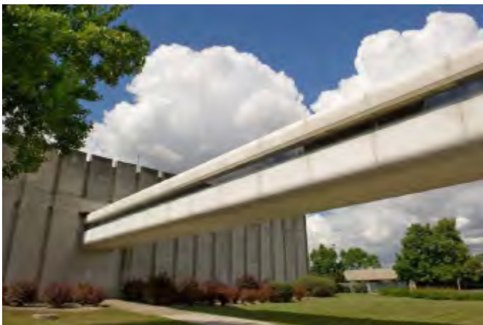
Site industriel de Pessac, Gironde