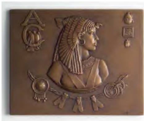
Emmanuel FREMIET , Cléopâtre , 1902 66x83 mm, bronze