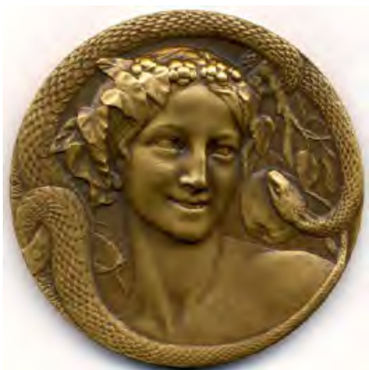
Henri DROPSY , Eve et le serpent , 1920 66 gr, Bronze