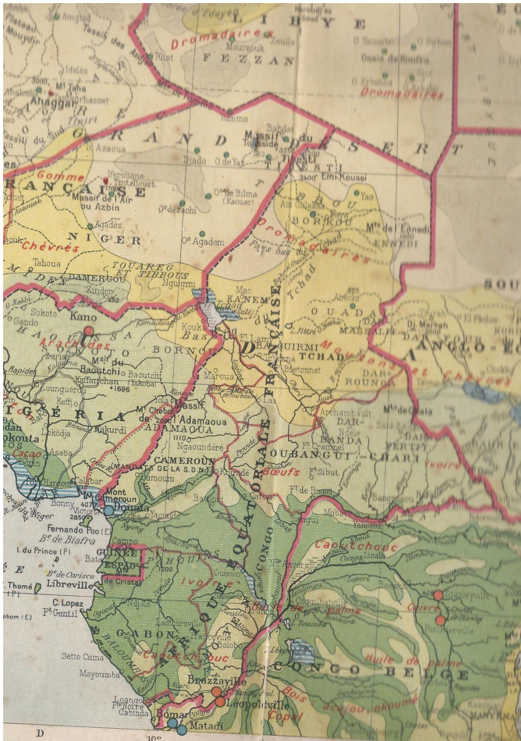
L'Afrique Equatoriale Française et le Cameroun ( F. Maurette, Atlas pratique , Hachette, Paris, 1930).